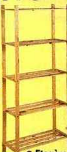
● Étagère 5 tablettes. 11,95 €. Castorama.

Peu onéreux, les meubles en pin sont faciles à peindre et vendus partout (grandes surfaces et magasins de bricolage). Ils offrent souvent plusieurs compositions possibles. Dans ce cas, il est bien d'en choisir de hauteurs et de largeurs différentes. On peut ainsi les associer, puis les peindre de la même couleur. Le rangement est optimisé et la déco assurée!